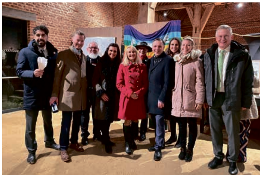
Die Neusser Delegation besuchte Leuven.