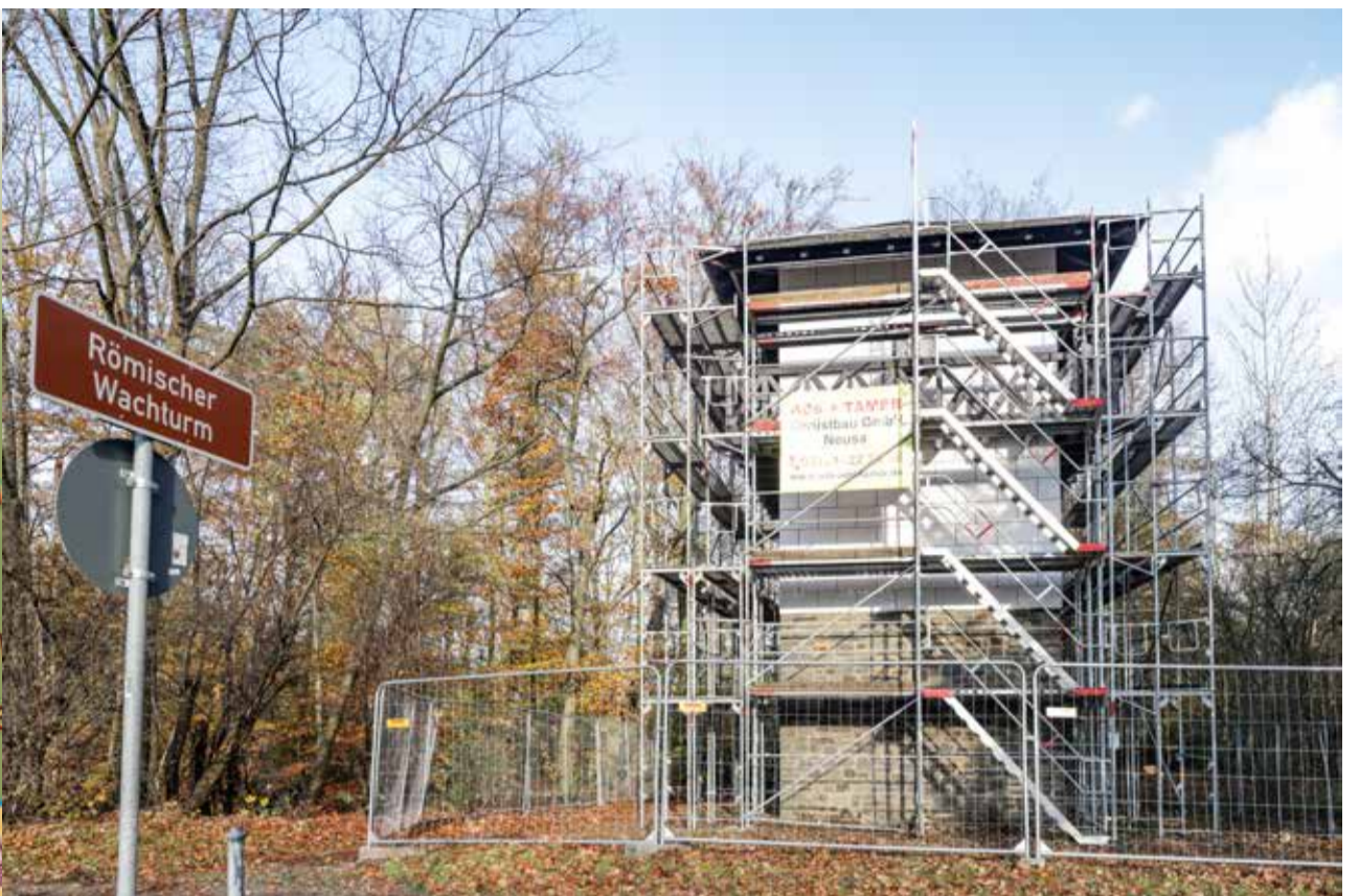
Der Nachbau des Wachturms am Reckberg wurde saniert.