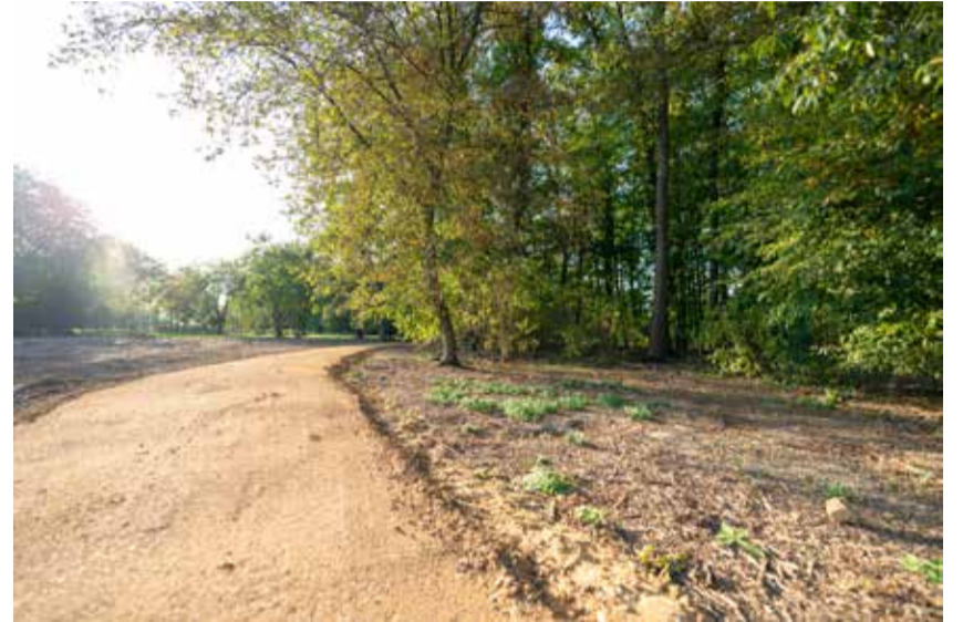
Auf dem Neusser Hauptfriedhof werden bald auch Bestattungen in einem Bestattungswäldchen angeboten.

Für welche Bestattungsform man sich auch entscheidet, wichtig ist, dass man sich entscheidet, so Rainer Lessmann. „Jeder sollte vorsorgen. Das muss ja nichts kosten.