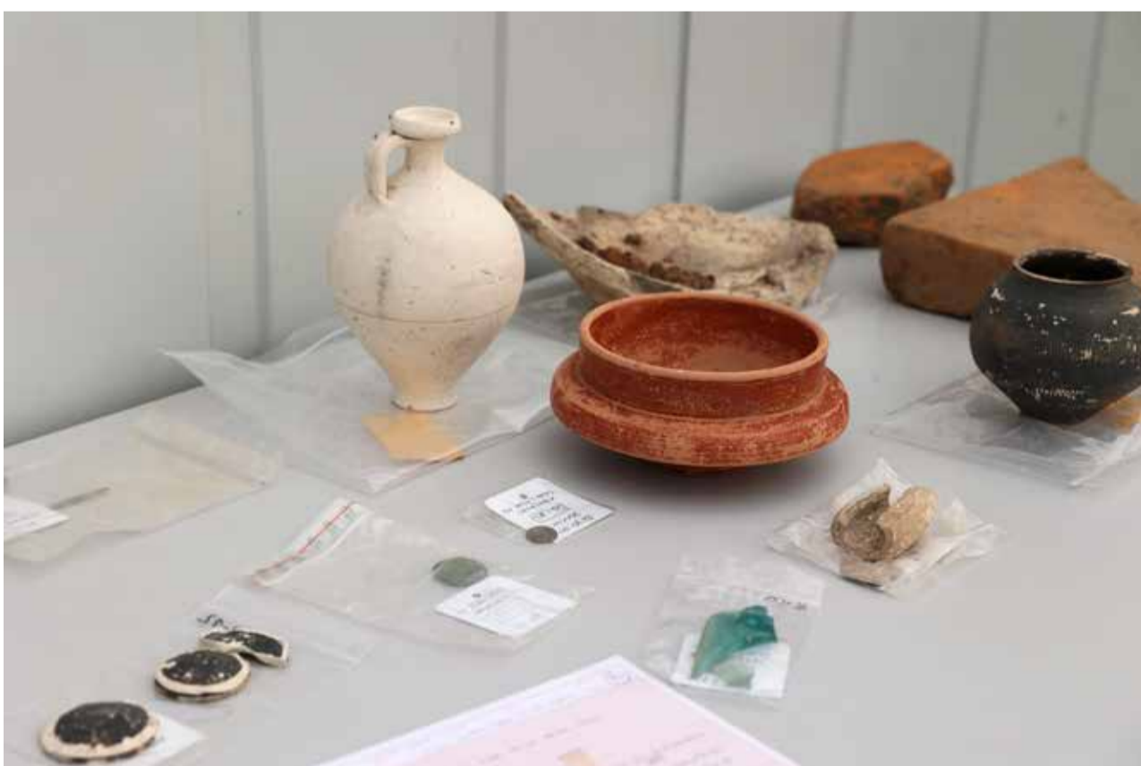
Fundstücke der Ausgrabungen zwischen Reckberg und Fleher Brücke.