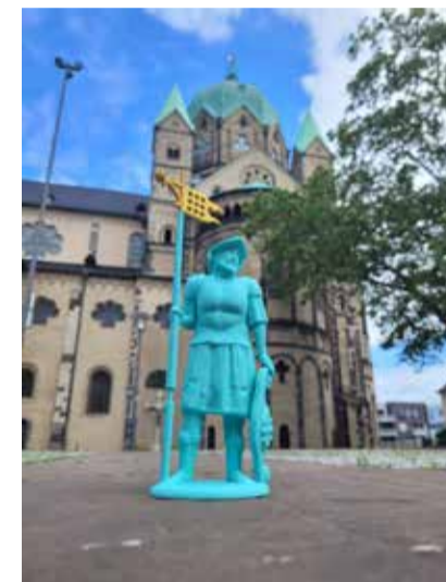
Schön in der Adventszeit: eine Glühweinführung durch die Neusser Innenstadt. Eine schöne Geschenkidee: Der Heilige Quirinus als 3D-Modell