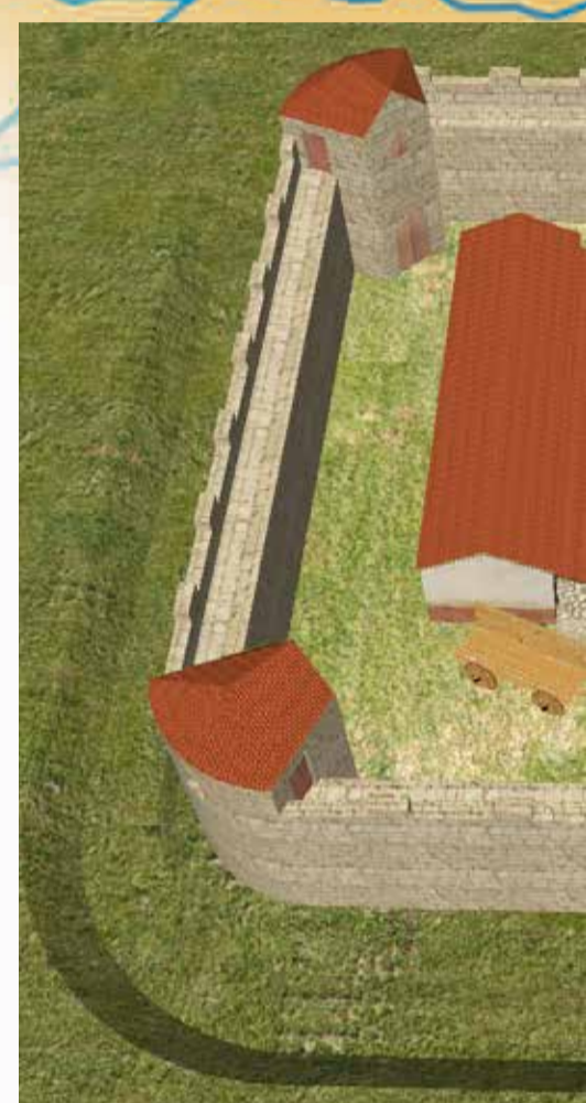
Visualisierung des römischen Kleinbauernsiedlung

Weitere Informationen finden Sie auch unter neuss.de/reckberg