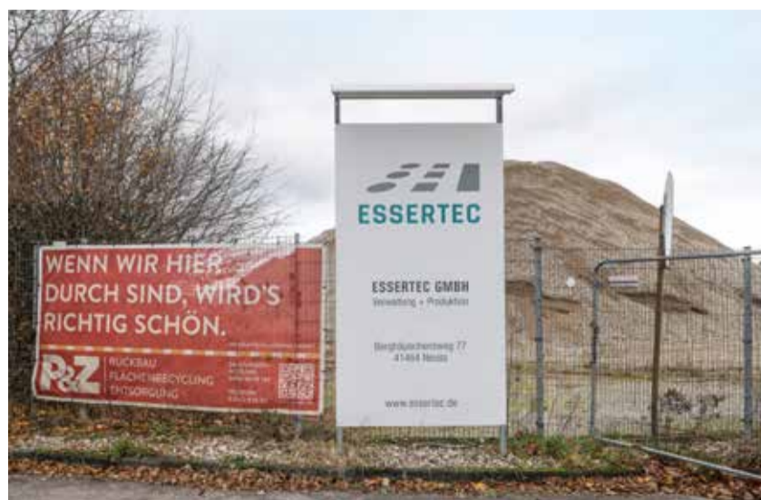
Noch eine Brachfläche, erwünscht ist aber eine Wohn-, Gewerbe- und Bürobauung mit Nahversorgungszentrum.

genden Wohnbebauung ebenfalls Gewerbe- und Bürobauten