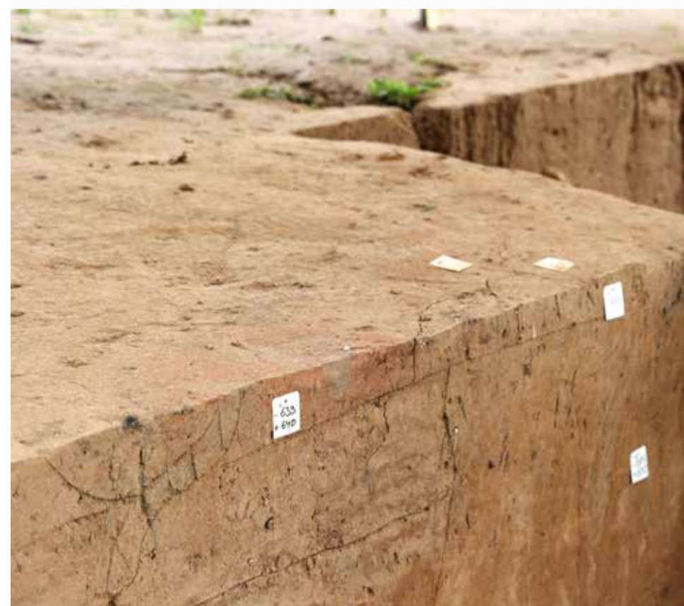
Detailaufnahme der Ausgrabungsstätte zwischen Reckberg und Fleher Brücke.