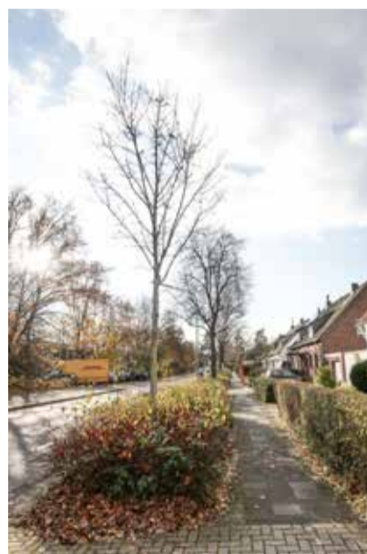
Baumpflanzungen, wie hier auf der Aurinstraße, beleben das Stadtbild.

man über eine Suchfunktion den Baum finden, an dem man gerade steht und über den man mehr wissen möchte. In der Datenbank ist jeder Baum mit seinem Standort verzeichnet – Stadtteil, Adresse und sogar Geopunkt. Zusätzlich sind die botanischen Bezeichnungen